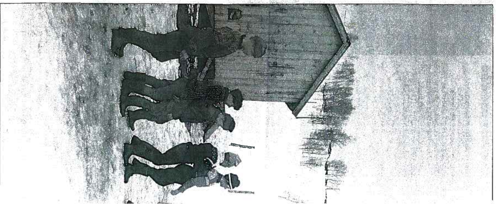
STOR GJENVIST: Byråkratar og politikarar ut til å tru at nedlegging av skular er ein fordel. Bilde frå Komagfjord skule i Finnmark, 1962.

SØF har gjort regresjonsanalyser av prøveresultat (avhengig variabel) som ein funksjon av ulike eigenskapar eller variablar som kan målast. Desse variablane er ifølgje rapporten forhold ved elevane sin bakgrunn (fars/mors utdanning, yrke og innkomst), ved skulen (skuletype, elevtal ved skulen/i klassen, tal jenter/gutar i klassen, lærars kjønn og utdanning) og ved skulestaden (fylke, kommunesortelk, og innleiktsnivå). I teorien vil det då vere slik at dersom alle viktige forhold som har innverknad på elevars prøveresultat kom med i oppsettet, ville vi kunne «forkla-